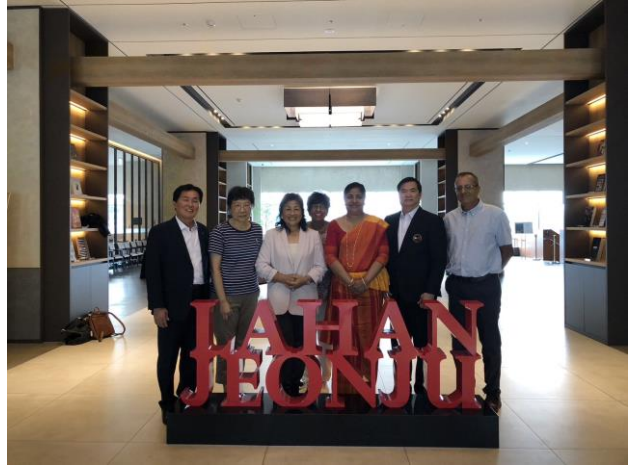
與會各國代表合影。